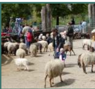
Der großzügig angelegte Kinderspielplatz mit Streichelzoo lädt Jung und Alt zum verweilen ein.