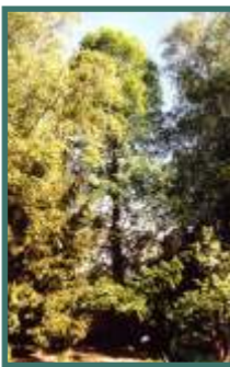
Der Zoo Neuwed ist ein Tierpark in dem auch eine Vielzahl von Bäumen ausgeschildert ist.