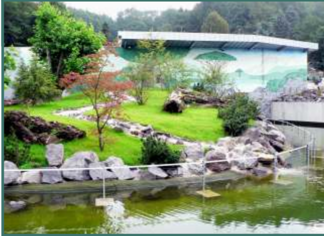
Für die Schimpansen wurde die ca. 1 ha große Menschenaffenanlage ganz neu gebaut!