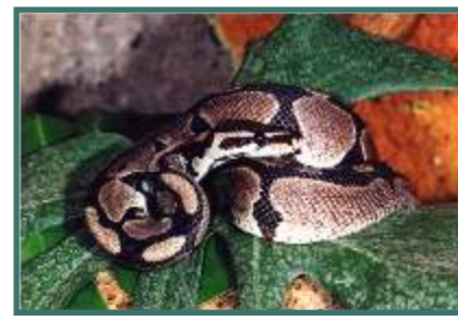
Seltene und vom Aussterben bedrohte Tierarten. In der "Arche Noah" von heute können sie überleben.