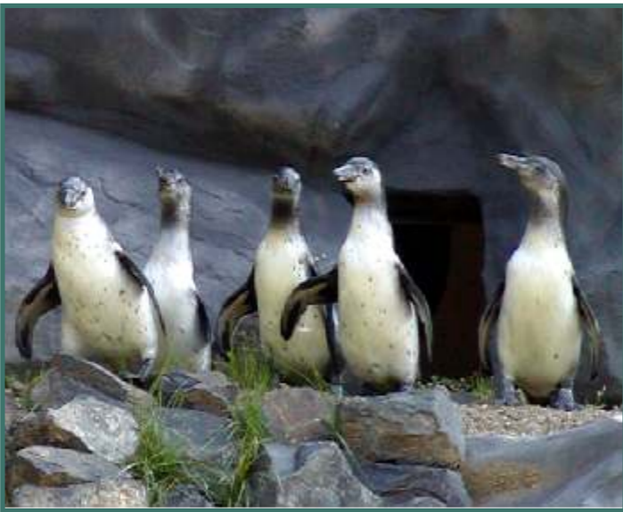
Jeden Tag werden die Humboldtpinguine gefüttert. Außer Freitagsvormittags findet diese Fütterung immer um 10.15 Uhr und um 15.15 Uhr statt.